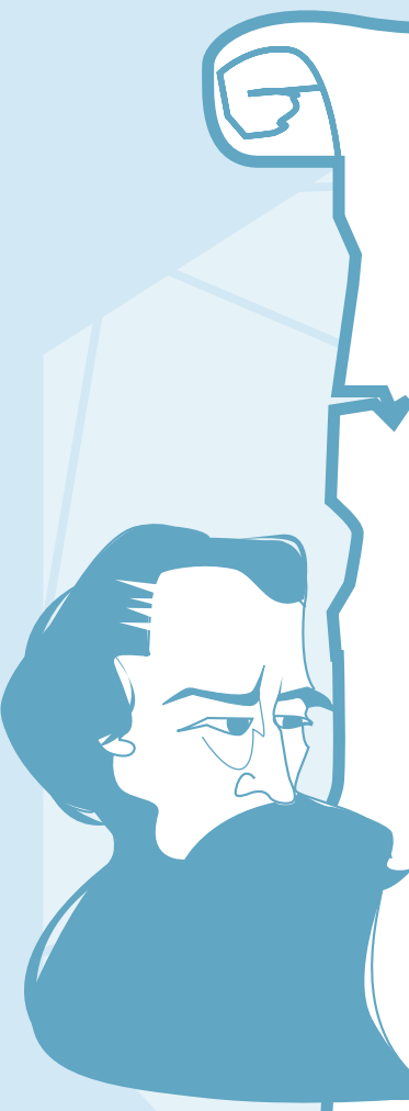
SÃO PAULO APÓSTOLO (3 d.C. / 67 d.C. †)