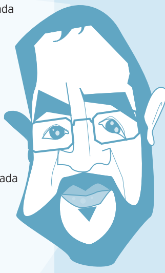
RENATO RUSSO COMPOSITOR E VOCALISTA (1960/1996 †)

Legião Urbana Composição: Renato Russo (recortes de "1 Coríntios 13", do Apóstolo São Paulo e do "Soneto 5", de Camões). Ainda que eu falasse a língua dos homens. E falasse a língua do anjos, sem amor eu nada seria. É só o amor, é só o amor. Que conhece o que é verdade. O amor é bom, não quer o mal. Não sente inveja ou se envaidece. O amor é o fogo que arde sem se ver. É ferida que dói e não se sente. É um contentamento descontente. É dor que desatina sem doer. Ainda que eu falasse a língua dos homens. E falasse a língua dos anjos, sem amor eu nada seria. É um não querer mais que bem querer. É solitário andar por entre a gente. É um não contentar-se de contente. É cuidar que se ganha em se perder. É um estar-se preso por vontade. É servir a quem vence, o vencedor; É um ter com quem nos mata a lealdade. Tão contrário a si é o mesmo amor. Estou acordado e todos dormem todos dormem todos dormem. Agora vejo em parte, mas então veremos face a face. É só o amor, é só o amor. Que conhece o que é verdade. Ainda que eu falasse a língua dos homens. E falasse a língua do anjos, sem amor eu nada seria.